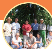
産直センターふくしま