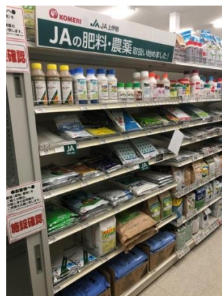
店内農業資材売場