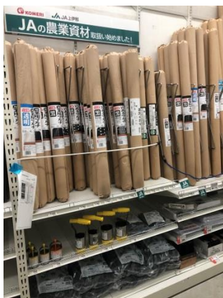
店内農業資材売場